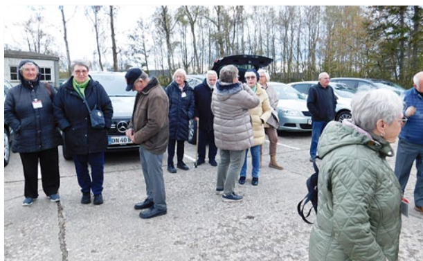
Køligt men heldigvis tørt vejr for de fremmødte

Til 367 årsdagen i år havde vores Soldaterforening for længst i en annonce i Gyldenløve indbudt til en lille ceremoni ved regimentets sten på Nørre Uttrup Kaserne