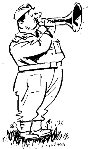
Menig 66 blæser honnør