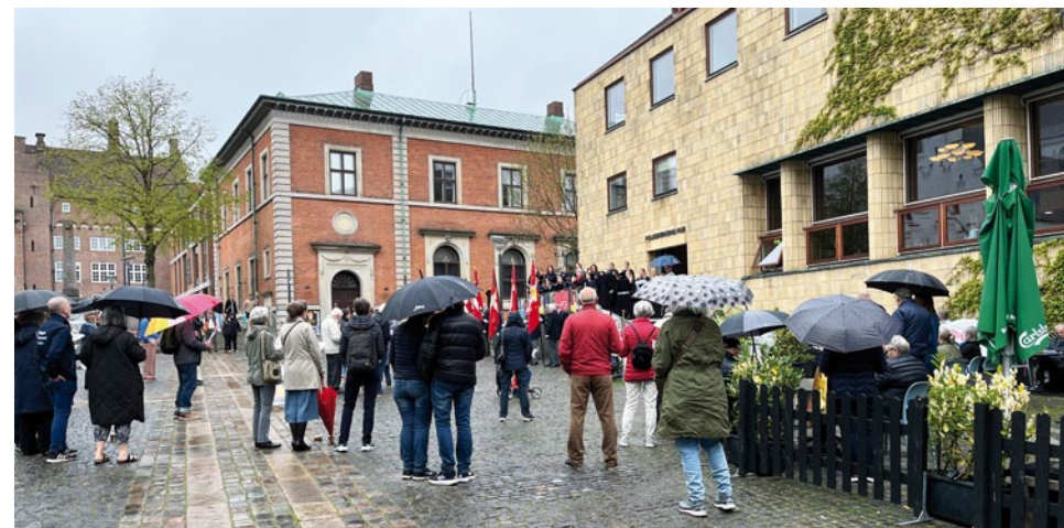
De fleste publikummer hørte til de ældre seniorer

op ad væggen ved Folkekirkens Hus, hvor nogle søde damer, var parate til at skænke op.